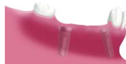
Zwei eingeeilte Implantate