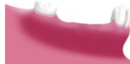
Situation nach Verlust mehrerer Zähne (Schaltlücke)

So sieht eine Freundsituation aus. Die Zahl der Implantate hängt ab von der Größe der Lücke, der Belastung und den Gegebenheiten in Ihrem Kiefer.