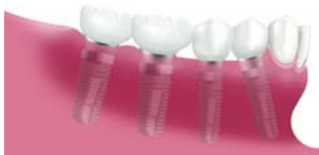
Vier einzelne Zahnkronen auf vier Implantaten

Die sogenannte Freundsituation tritt ein, wenn Ihnen am Ende einer Zahnreihe mehrere Backenzähne fehlen. Hier ist das Implantat die beste und die einzige Lösung für einen festsitzenden Zahnersatz. Ohne Implantate ist nur eine herausnehmbare Teilprothese mit all ihren Nachteilen möglich. Es müssen dabei mechanische Halteelemente, wie z.B. Klammern angebracht werden, welche die Optik und den Tragekomfort beeinträchtigen.