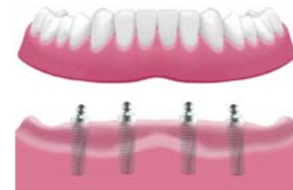
Verankerung der Prothese mit Kugelaufbauten