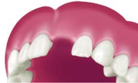
Situation nach Zahnverlust