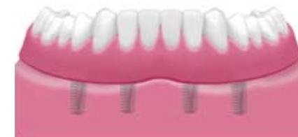
Implantatgetragene herausnehmbare Prothese