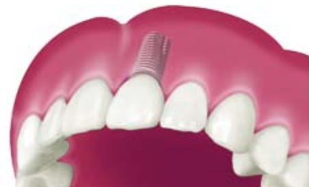
Mit Zahnkrone versorgtes Implantat