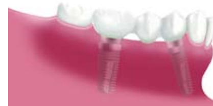
Dreigliedrige Brücke auf zwei Implantaten