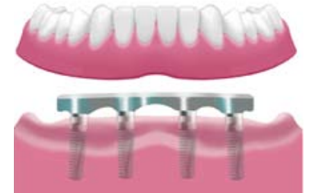
Verankerung der Prothese mit einem Steg