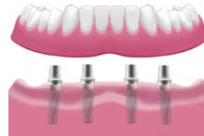
Verankerung der Prothese mit Doppelkronen